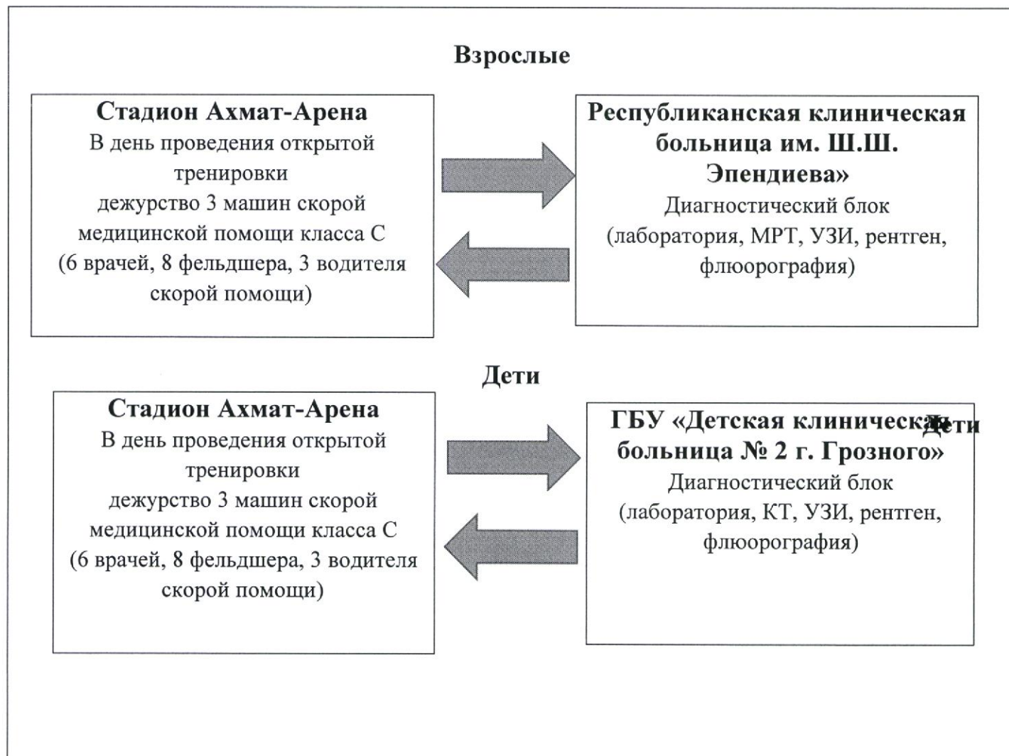
Схема медицинского обеспечения зрителей в день открытой тренировки Чемпионата мира по футболу FIFA 2018.